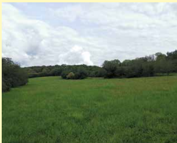
Prairie engagée en Mesure Agro-Environnementale et Climatique

Les campagnes précédentes ont rencontré un grand succès, avec une centaine d'agriculteurs du territoire engagés dans des mesures de réduction de traitements phytosanitaires, de création ou de gestion de prairies, d'entretien de haies, mares, fossés, ou vergers, entre autres. Le nouveau PAEC continue sur cette lancée, avec sur sa première année une soixantaine d'agriculteurs reconduisant des mesures ou s'engageant pour la première fois dans le dispositif.