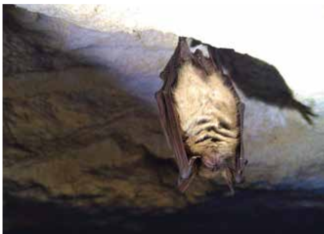
Murin à oreilles échanquées

Louise-Anne a donc établi des cartographies des territoires de chasse potentiels autour de chaque nurserie connue, en évaluant l'intérêt de chaque habitat pour l'espèce concernée. Les résultats de cette étude permettront une meilleure prise en compte des enjeux chiroptères en période estivale dans les sites Natura 2000, et des informations sur les zones à enjeux à protéger dans le cadre de la nouvelle Stratégie de création d'Aires Protégées.