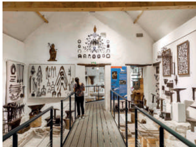
Musée de l'Outil