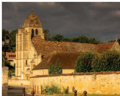
Eglise de Guiry-en-Vexin