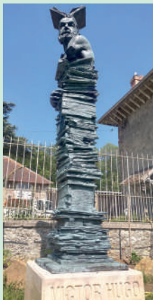
Victor Hugo. A.KASPER

L'Artiste a voulu, en usant de son talent, concrétiser la trace laissée dans la mémoire collective, par ceux qui ont, jadis, planté nos forêts, devenues aujourd'hui un élément essentiel du Patrimoine.