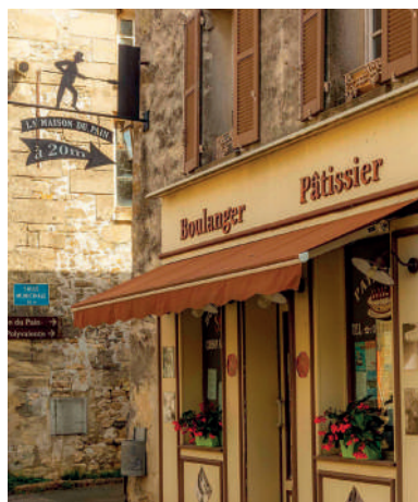
Maison du Pain à Commeny