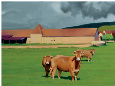
Exposition de Christian Broutin au musée du Vexin français