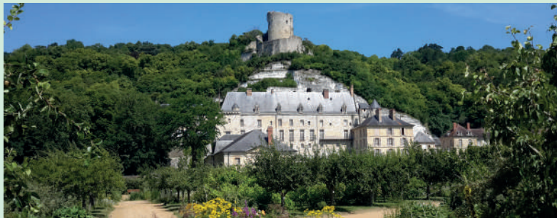
Château de La Roche-Guyon