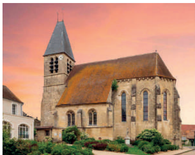
Eglise de Longuesse