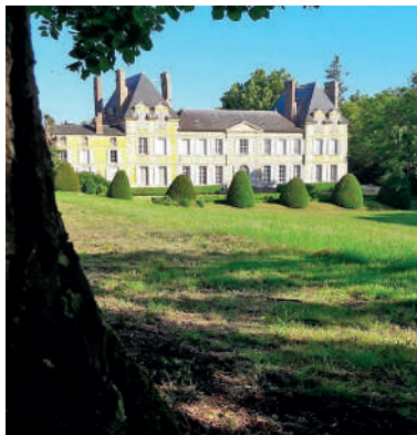
Château de Gadancourt