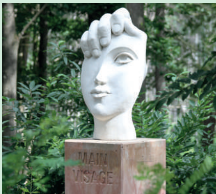
Main Visage. A.KASPER