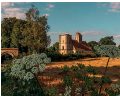
Eglise de Nucourt

géologique, constituée progressivement par sédimentation pendant 30 millions d'année, fut ensuite mise à l'air libre et creusée par l'érosion pour donner naissance à la vallée que l'on observe aujourd'hui et où la ville est nichée. La mise en évidence récente d'un spectaculaire glissement de terrain (glissement de Blamécourt) permet de visualiser les grandes débâcles qui eurent lieu lors des stades de réchauffement postglaciaires. Conçue par des géologues de CY Cergy-Paris Université, cette visite vous permettra découvrir la fascinante géologie du territoire grâce aux explications du guide et à une maquette 3D.