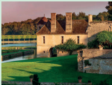
Domaine de Villarceaux