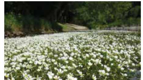
Renoncules à pinceau