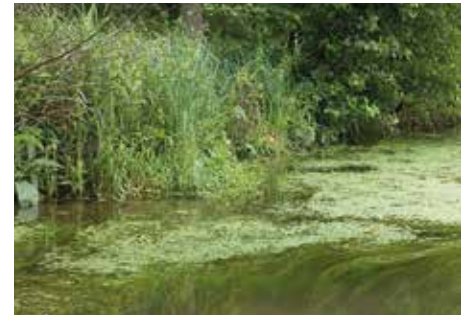
Rivière à renoncules

Les mesures de gestion proposées par le Document d'Objectifs incluent ainsi des travaux de renaturation des rivières (restauration des méandres et bras morts, de la diversité physique des cours d'eau), des mesures destinées aux espèces piscicoles (effacement des obstacles à la migration, restauration des zones de frayères), et des mesures de restauration et entretien de la végétation aquatique et des ripisylves (végétations des berges).