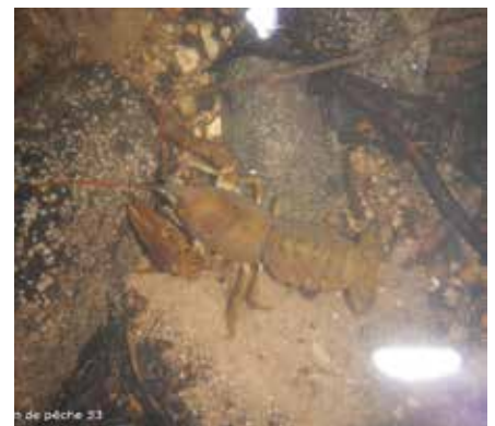
Ecrevisse à pattes blanches