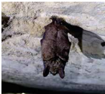
Murin à oreilles échanquées