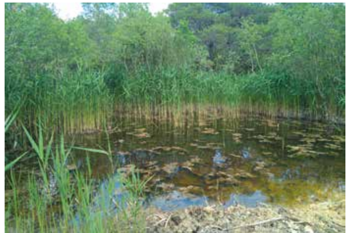
Mare de la Butte du Hutrel (après travaux)