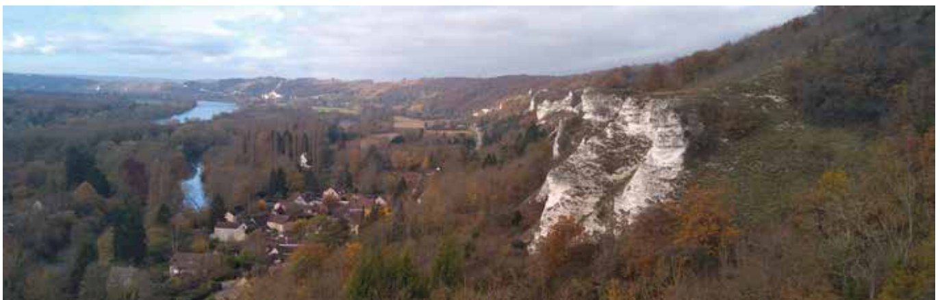
Vue sur les pitons crayeux de la Réserve naturelle nationale des coteaux de la Seine