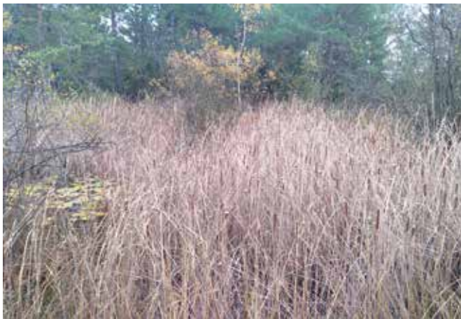
Mare de la Butte du Hutrel (avant travaux)

• Une autre espèce emblématique de la Vallée de l'Epte, l' écrevisse à pattes blanches , fait l'objet de suivis réguliers de la part de l'Office Français de la Biodiversité. En 2021, le secteur de Chaussy a été prospecté, et plus de 500 individus ont été comptabilisés, soit un chiffre très important à l'échelle de l'Ile-de-France !